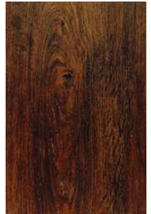
2 – WALNOUT OAK