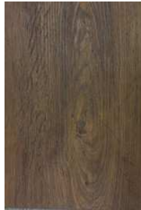
2 – COGNAC OAK