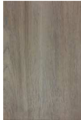
2 – ROBLE NORGEN