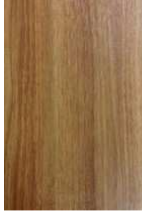
1 – TROPICAL WOOD