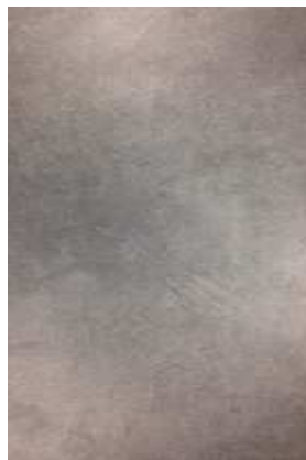
1 – CEMENT BLACK