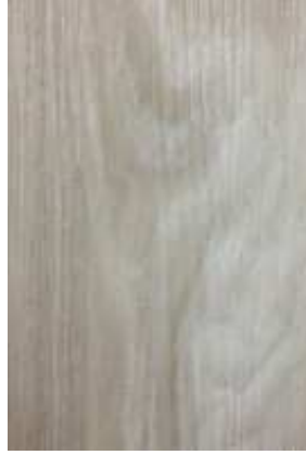
1 – ROBLE OKLAND