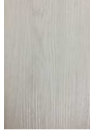
1 – ROBLE ARTIC