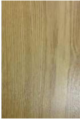
1 – ROBLE AMERICANO