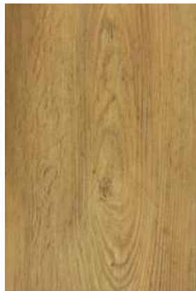
2 – CANADIAN OAK